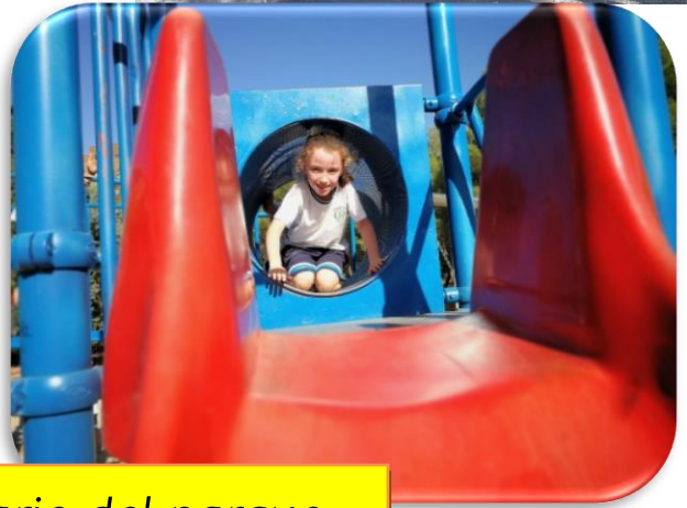
Juegos con el mobiliario del parque