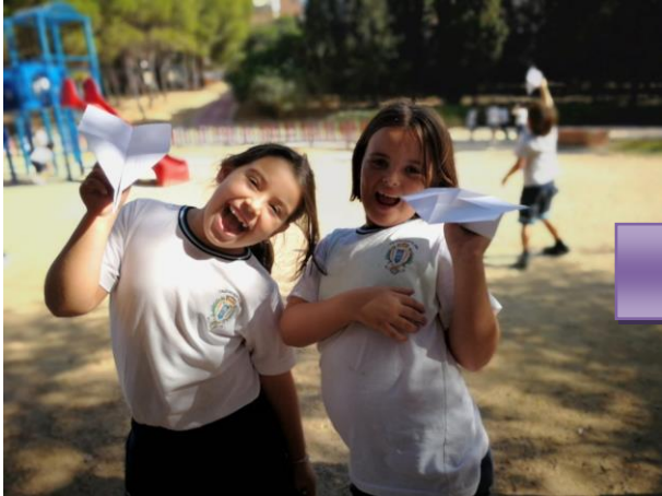
Pajaritas de papel