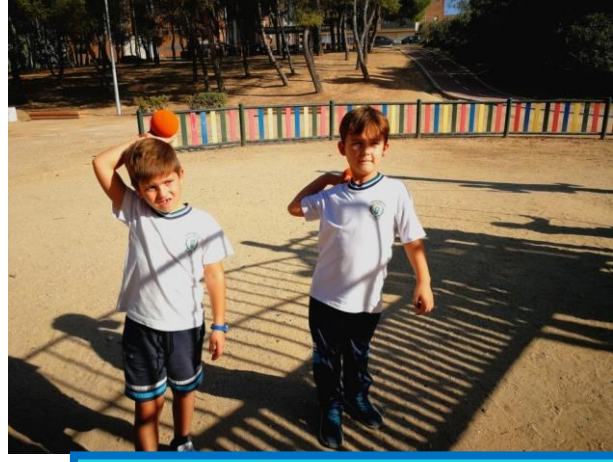
Lanzamiento de precisión