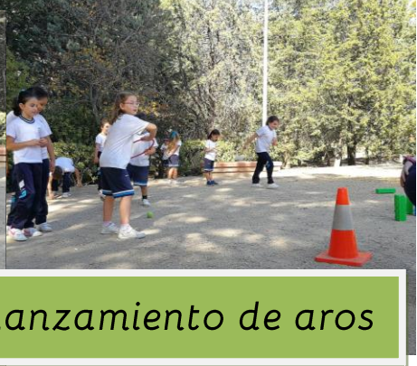
Lanzamiento de aros