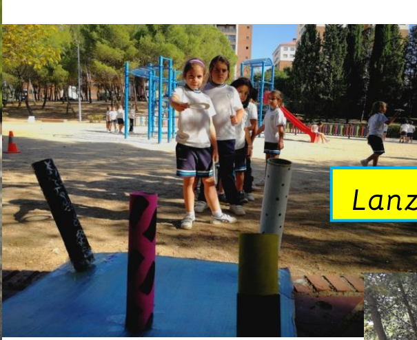
Lanzamiento de anillas