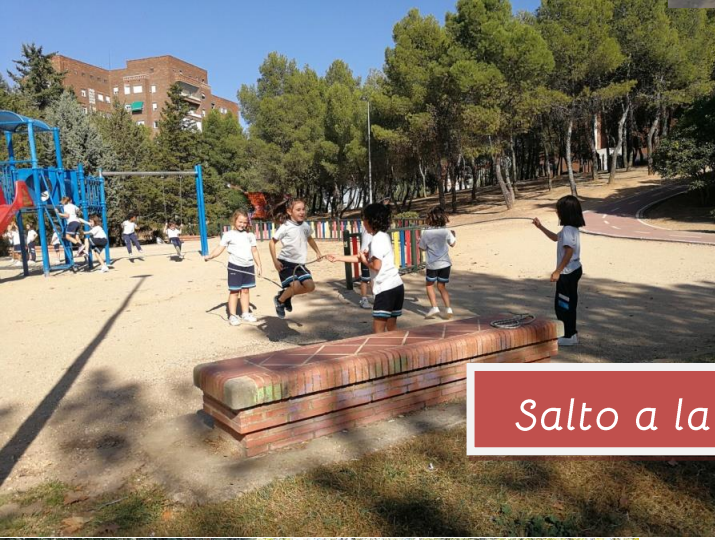
Salto a la comba